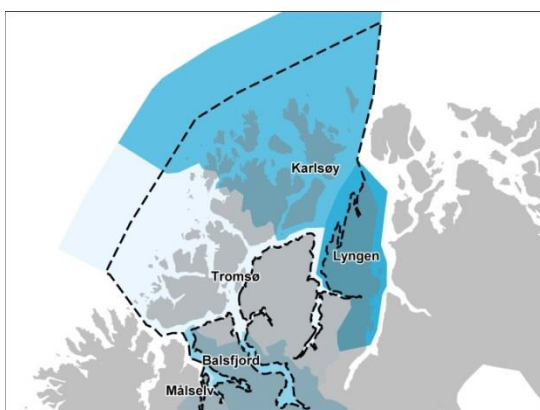
Figur 1. Kystplan Tromsøregionen er et samarbeid mellom kommunene Målselv, Balsfjord, Tromsø, Lyngen og Karlsøy.

Det blir også utarbeidet kystzoneplaner for Nord-Troms og for Midt- og Sør-Troms, alle tre planene er en del av prosjektet Kystplan Troms i regi av Troms fylkeskommune.